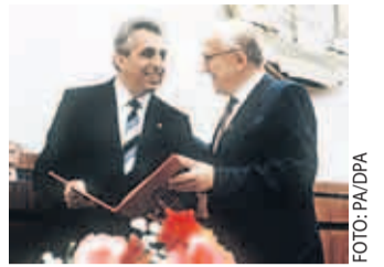
Horst Sindermann (r) gratuliert Egon Krenz

Berlin – Etwa 12 000 Menschen demonstrieren in der Ost-Berliner Innenstadt gegen das Votum der Volkskammer, die am Vormittag SED-Chef Egon Krenz zum Vorsitzenden des Staatsrates und Obersten Befehlshaber der Streitkräfte gemacht hat – erstmals gibt es bei Gegenstimmen bei einer solchen Wahl. Die Demonstranten fordern auf Transparenten „Modrow statt Krenz“.