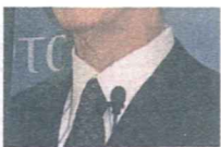
PTC-Chef Harrison: „Wir versuchen es unseren Anwendern möglichst einfach zu machen.“

„Wir haben auf der einen Seite für Konstruktion und Design unsere Lösung Pro/Engineer. Zudem haben wir für die Anforderung